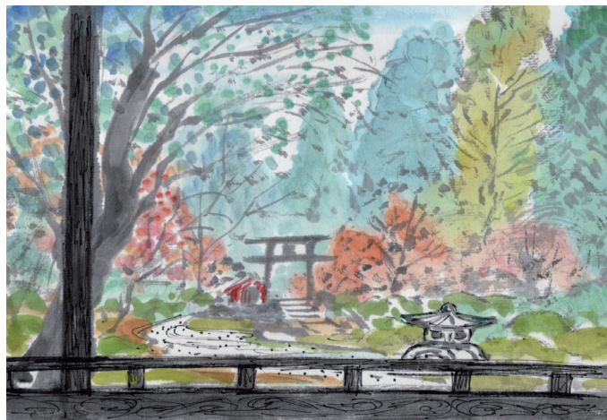
小江戸川越 宿の二階からの眺め